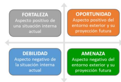
Fig. 3 – Matriz FODA

El estudio del contexto se completó con el análisis FODA (Fortalezas, Oportunidades, Debilidades y Amenazas) que se muestra en la Fig. 4 y permite establecer el posicionamiento de una organización respecto a su contexto y a su situación interna y es el paso inicial para generar la matriz de riesgos y oportunidades.