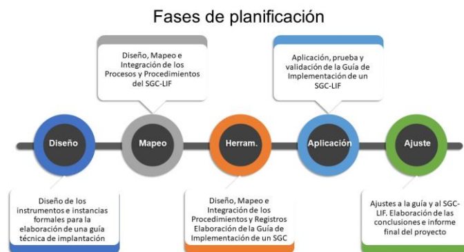
Fig. 1 - Fases de Planificación del Proyecto

Para el desarrollo del proyecto se determinaron inicialmente ocho tareas divididas en cinco etapas, las que fueron planteadas inicialmente en el proyecto y pueden observarse en la Fig 1.