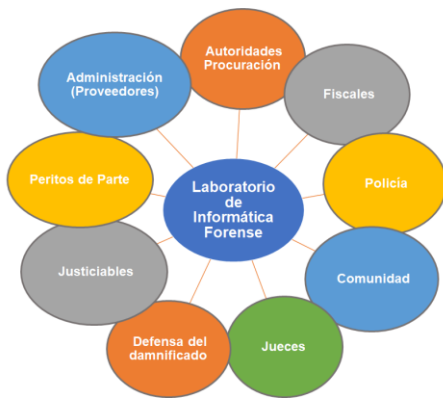
Fig. 3 - Mapa de Partes Interesadas - LIF Mar del Plata

Continuando con el análisis de contexto, el generar un mapa de permite establecer las interrelaciones de la organización con su entorno. Se puede observar que el LIF presenta una realidad compleja al responder ante diferentes organismos judiciales. Se relaciona con distintas dependencias centralizadas de la Procuración General (que responden a la máxima autoridad del Ministerio Público bonaerense, el Procurador General). La asignación de recursos materiales y humanos, por ejemplo, es decidida en esas instancias. Formalmente, al comenzar el trabajo el LIF Mar del Plata era parte de una dependencia mayor, el Cuerpo de Ayuda Técnica a la Instrucción (CATI), que depende del Fiscal General del Departamento Judicial de Mar del Plata (la máxima autoridad del Ministerio Público Fiscal de dicho departamento), actualmente forma parte del Cuerpo de Peritos de la Fiscalía General de Mar del Plata. Pero, en la faz operativa, sus usuarios directos son mayoritariamente los fiscales titulares de las distintas Fiscalías de Mar del Plata. Este contexto puede generar perturbaciones en la planificación de sus procesos y en la posibilidad de cumplimiento de sus objetivos.